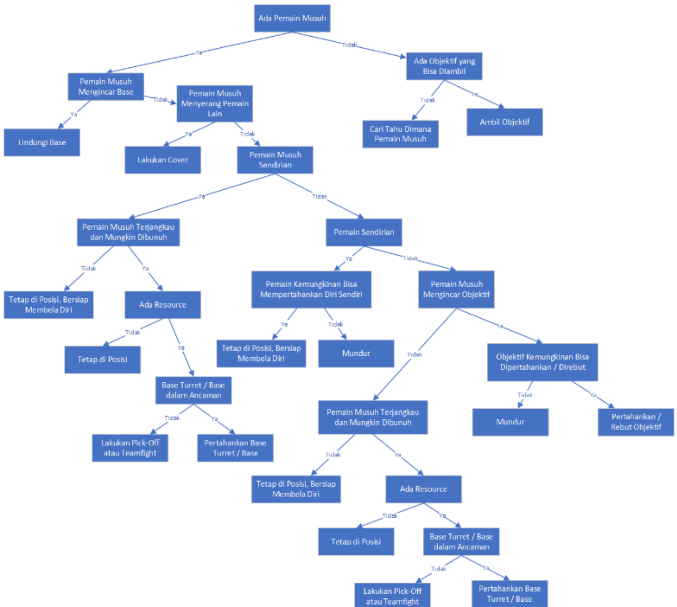
Gambar 4.2 Pohon Keputusan Tindakan